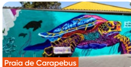
Praia de Carapebus